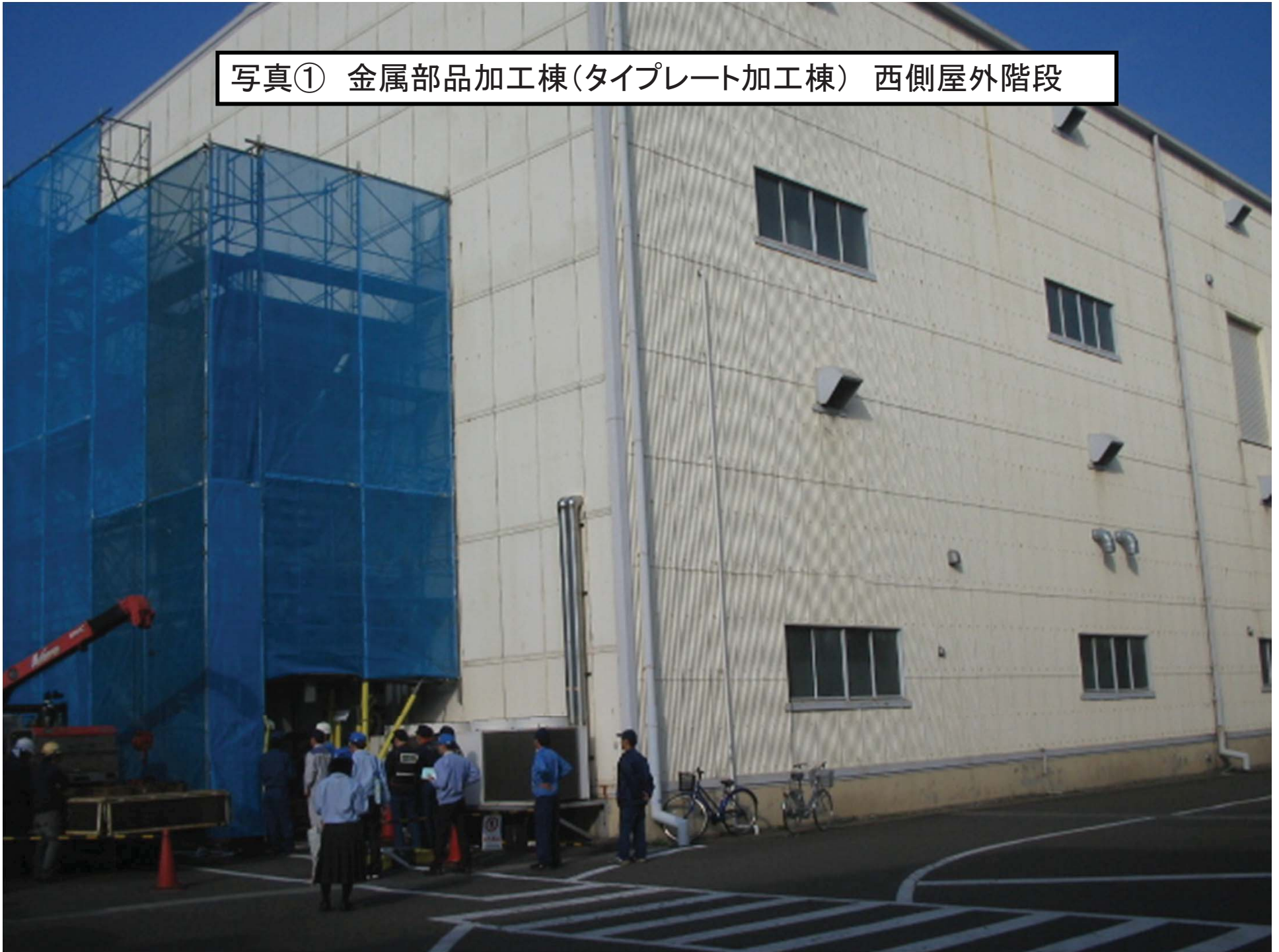
写真① 金属部品加工棟(タイプレート加工棟) 西側屋外階段